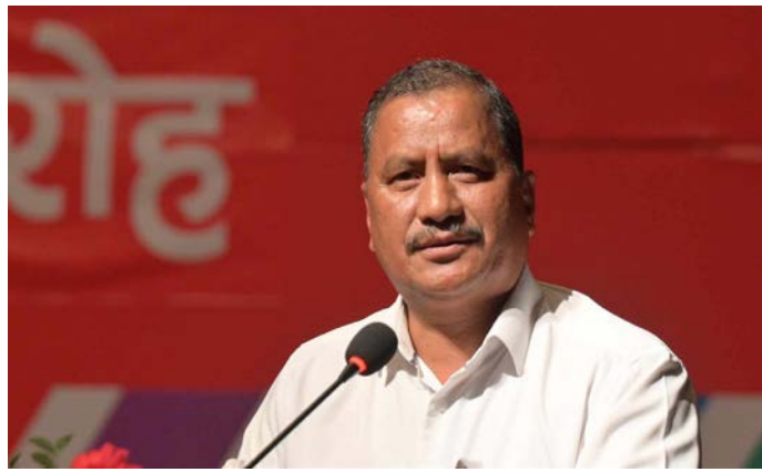
महासचिव चन्दले देश र नेपाली जनताको सुख तथा समृद्धिका सधैं काम गरिरहने विचार प्रकट गरे। पार्टी

काठमाडौं/मस- नेपाल कम्युनिष्ट पार्टीका महासचिव नेत्रविमल चन्दले नेपाली विशेषताको समाजवाद स्थापना नभएसम्म क्रान्तिबाट विश्राम नलिने दृढता व्यक्त गरेका छन्। नेत्रविमल चन्दको नेतृत्वमा रहेको नेपाल कम्युनिष्ट पार्टीको ११औं स्थापना दिवसका अवसरमा भूकुटीमण्डपमा शनिवार आयोजित सभामा उनले ८० को दशकलाई राष्ट्रिय स्वाधिनता, समाजवाद निर्माणलाई केन्द्रित गरी आफ्ना कार्यक्रम र राजनीतिक गतिविधि अघि बढाउने धारणा राखे। विगतमा नेकपा (माओवादी) मा रही नेपाली जनताको परिवर्तनको चाहना र न्यायका लागि गरेको योगदान इतिहास साक्षी रहेको बताउँदै